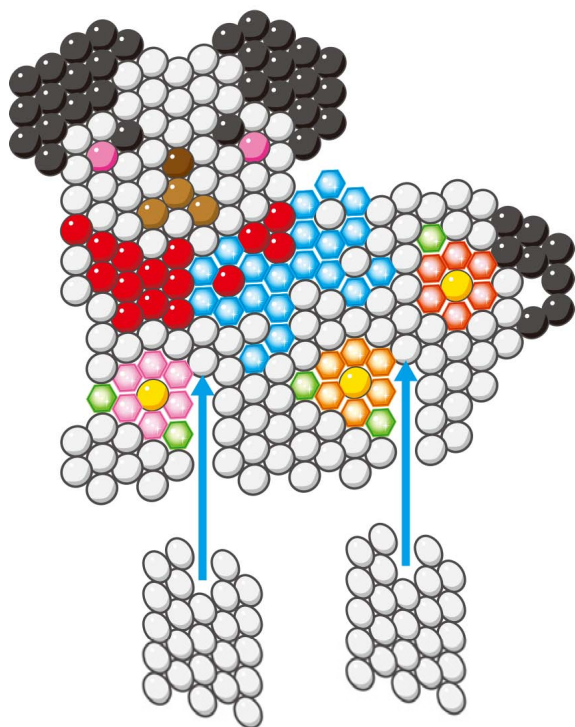
かんせいみほん 完成見本